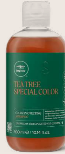
TEA TREE SPECIAL COLOR ŞAMPUANI 300 ML

CANLANDIRICI VE RENK SOLMALARINI ÖNLEYİCİ Renk koruyucu formül, günlük kirleri nazikçe saçtan temizler ve canlı bir parlaklık kazandırır.