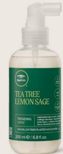
TEA TREE LEMON SAGE DOLGUNLAŞTIRICI SPREY® 200 ML

STİL GÜÇLENDİRİCİ, NAZİK BAKIM Doğal canlılık ile hacimli saç tellerini ısıdan korumaya yardımcı olur.