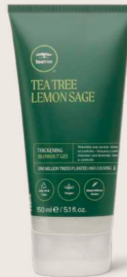
TEA TREE LEMON SAGE FÖN JELİ 150 ML

STİL GÜÇLENDİRİCİ, NAZİK BAKIM Doğal canlılık ile hacimli saç tellerini ısıdan korumaya yardımcı olur.