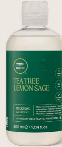
TEA TREE LEMON SAGE DOLGUNLAŞTIRICI ŞAMPAN® 300 ML

DOLGUNLAŞTIRICI ŞAMPAN İnce saç tellerini dolgunlaştırarak saçlarda temiz, dolgun ve sağlıklı görünüm ve hissiyat sağlar.