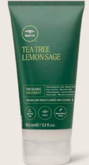
TEA TREE LEMON SAGE DOLGUNLAŞTIRICI MASKE 150 ML

SAÇ BOYLARINI DESTEKLEYEN BAKIM KREMİ Saça dolgunluk, yumuşaklık ve parlaklık kazandırarak hacimli saç görünümünü destekler.