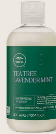
TEA TREE LAVENDER MINT NEMLENDİRİCİ ŞAMPUAN 300 ML

NEMLENDİRİCİ, RAHATLATICI VE TEMİZLEYİCİ BAKIM Kuru ve sert saçları temizler, rahatlatır ve yeniler.