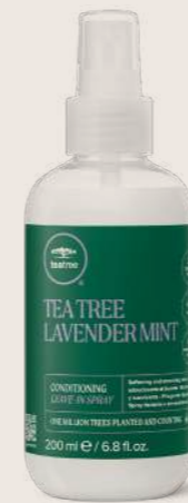
TEA TREE LAVENDER MINT NEMLENDİRİCİ DURULANMAYAN BAKIM SPREYİ 200 ML

YUMUŞATAN VE PÜRÜZSÜZLEŞTİREN BAKIM Durulanmayan bakım, saç tellerini yeniler .