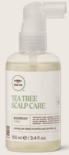
TEA TREE SCALP CARE REGINEPLEX® TONİK 100 ML

DAHA DOLGUN GÖRÜNEN SAÇLAR İÇİN NEMLENDİRİCİ İnce ve kırılgan saçları ağırlaştırmadan yumuşatır ve güçlendirir.