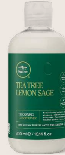
TEA TREE LEMON SAGE DOLGUNLAŞTIRICI BAKIM KREMİ® 300 ML

DOLGUNLAŞTIRICI ŞAMPAN İnce saç tellerini dolgunlaştırarak saçlarda temiz, dolgun ve sağlıklı görünüm ve hissiyat sağlar.