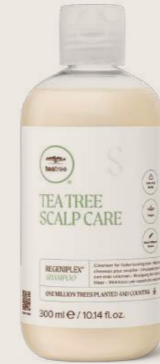
TEA TREE SCALP CARE REGINEPLEX® ŞAMPUAN 300 ML

DAHA DOLGUN GÖRÜNEN SAÇLAR İÇİN ŞAMPUAN Baş derisini nazikçe temizler ve saçın daha güçlü büyümesini destekler.