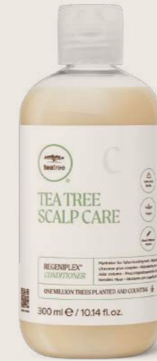
TEA TREE SCALP CARE REGINEPLEX® BAKIM KREMİ 300 ML

DAHA DOLGUN GÖRÜNEN SAÇLAR İÇİN ŞAMPUAN Baş derisini nazikçe temizler ve saçın daha güçlü büyümesini destekler.