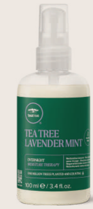
TEA TREE LAVENDER MINT OVERNIGHT THERAPY NEMLENDİRİCİ GECE BAKIMI 100 ML

DERİNLEMESİNE NEMLENDİRME İÇİN Kremsi, ultra zengin saç maskesi saçları güçlendirmeye ve nemlendirmeye yardımcı olur.