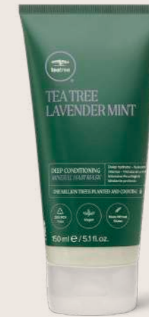
TEA TREE LAVENDER MINT MİNERAL SAÇ MASKESİ 150 ML

YUMUŞATAN VE PÜRÜZSÜZLEŞTİREN BAKIM Durulanmayan bakım, saç tellerini yeniler .