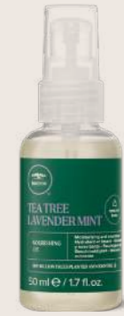
TEA TREE LAVENDER MINT BESLEYİCİ YAĞ 50 ML

YATIŞTIRICI BAKIM Kuru ve dokulu saçları nemlendirir, kontrol altına alır, yumuşatır ve yatıştırır