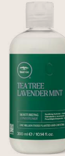
TEA TREE LAVENDER MINT NEMLENDİRİCİ BAKIM KREMI 300 ML

NEMLENDİRİCİ, RAHATLATICI VE TEMİZLEYİCİ BAKIM Kuru ve sert saçları temizler, rahatlatır ve yeniler.