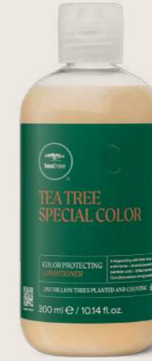
TEA TREE SPECIAL COLOR BAKIM KREMI 300 ML

CANLANDIRICI VE RENK SOLMALARINI ÖNLEYİCİ Renk koruyucu formül, günlük kirleri nazikçe saçtan temizler ve canlı bir parlaklık kazandırır.